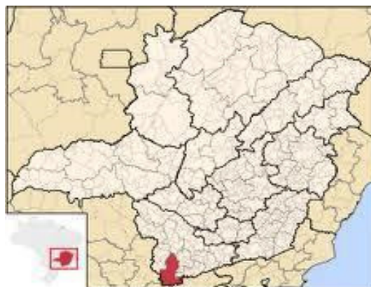
Figura 1 - Microrregião de Pouso Alegre.

O município de Pouso Alegre está situado no extremo sul de Minas Gerais na Mesorregião do Sul e Sudeste de Minas. A microrregião de Pouso Alegre engloba os municípios de Bom Repouso, Borda da Mata, Bueno Brandão, Camanducaia, Cambuí, Congonhal, Córrego do Bom Jesus, Espírito Santo do Dourado, Estiva, Extrema, Gonçalves, Ipuiuna, Itapeva, Munhoz, Pouso Alegre, Sapucaí-Mirim, Senador Amaral, Senador José Bento, Tocos do Moji e Toledo.